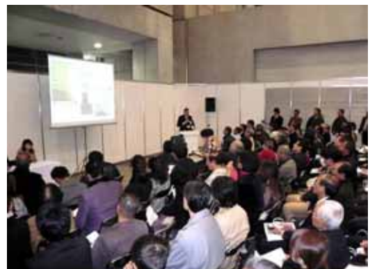
2007 賃貸住宅フェアでの石川氏の講演の様子

お申し込み先：クレハ錦建設(株) ヒーローマンション営業部 Tel.0120-246-908